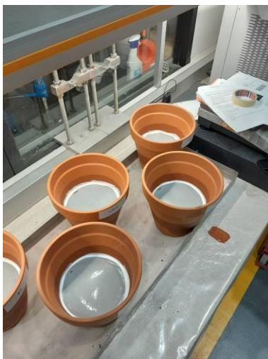
Barreras geosintéticas colocadas y selladas