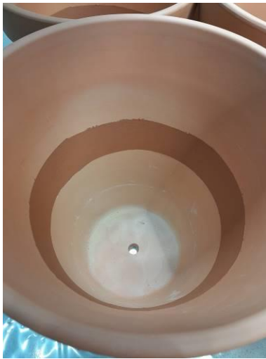
Vasija con la banda pintada