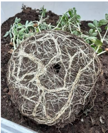
Raíces de altramuz después de 7 semanas