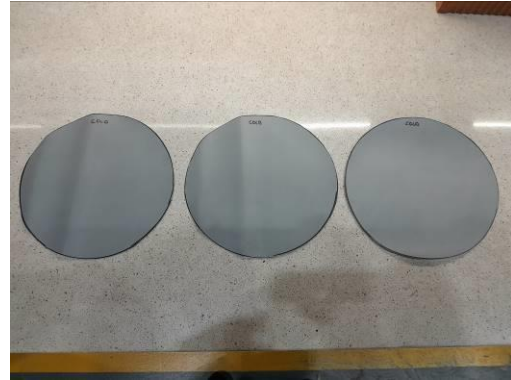
Discos cortados de la barrera geosintética