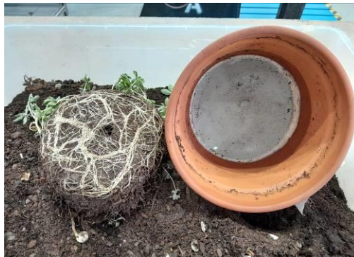
Aspecto tras el vaciado después de 7 semanas