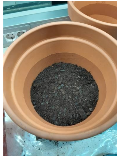
Primera capa de tierra hasta el borde inferior