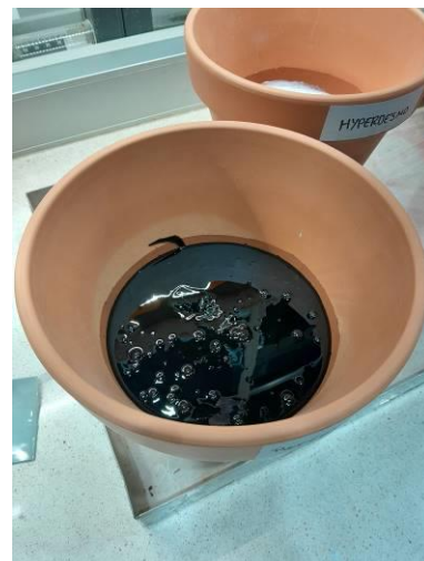
Vasija de referencia con 20 mm de espesor de betún