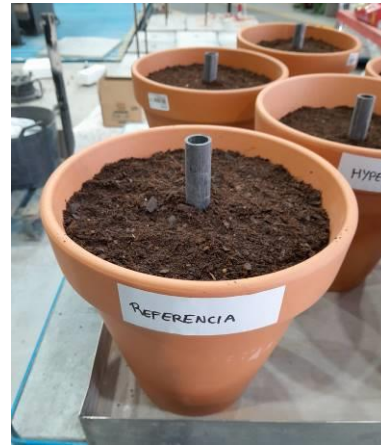
Vasija de referencia terminada