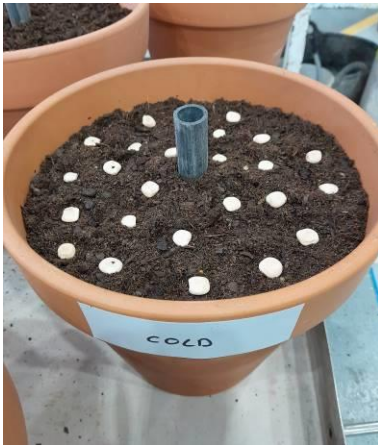
Semillas de altramuz sembradas