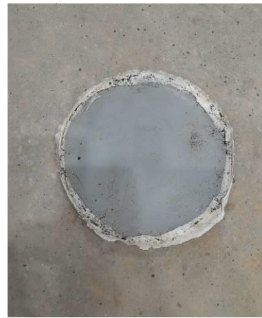
Aspecto de la barrera geosintética tras el ensayo